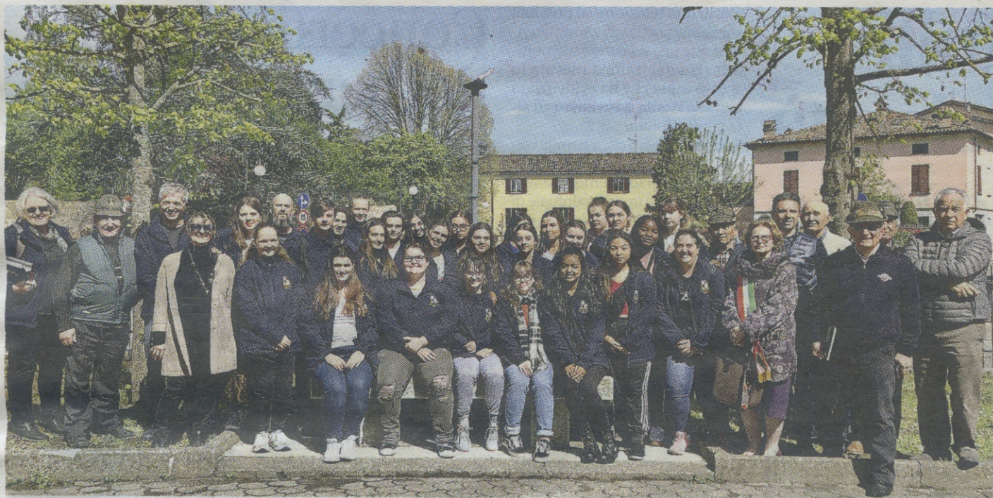
Il gruppo di studenti australiani con il loro insegnante piacentino, il sindaco e il comitato d'accoglienza locale