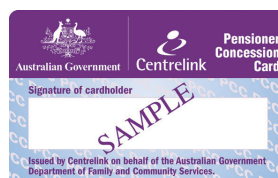
Pensioner Concession Card (Tarjeta de Concesiones para Pensionados)